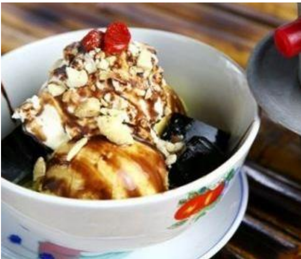
Kem Café ¥600 税込660 「ケムカフェ」 バニラアイスのベトナムコーヒーがけ フランス統治時代の名残、ベトナムコーヒーアフォガード

おいしい！ホイアンブレンドコーヒー（玉造 Daotaブレンド） ¥400 デザートとのセット注文の場合は、¥-100 (Hot or ice)