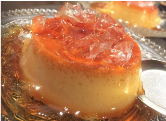
Bánh Flan ¥382 税込420 「バインフラン」 ベトナムカスタードプリン 牛乳を一切使わない、なめらかなベトナムプリン。 クラッシュアイスがのっているのがベトナム流！