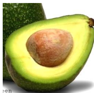
Kem Bơ 「ケムボー」 ベトナムのなめらかアボカドアイス ¥555 税込610