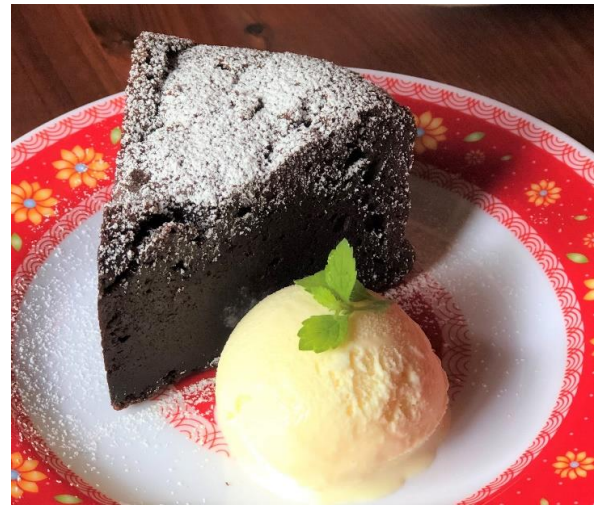
¥555 税込610 Sô cô la Hà Nội 「ショコラ ハノイ」 濃厚ガトーショコラ バニラアイス添え