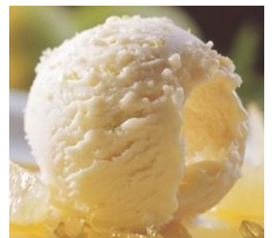
Kem Vani 「ケムヴァニ」 濃厚バニラアイス Kem Dừa 「ケムユア」 ココナッツミルクアイス 各¥300 税込330