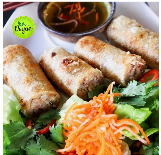
野菜と揚げ豆腐の揚げ春巻き