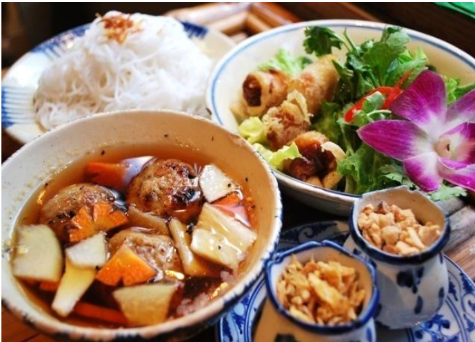
ブンチャー (スペシャル混ぜ混ぜ麺)