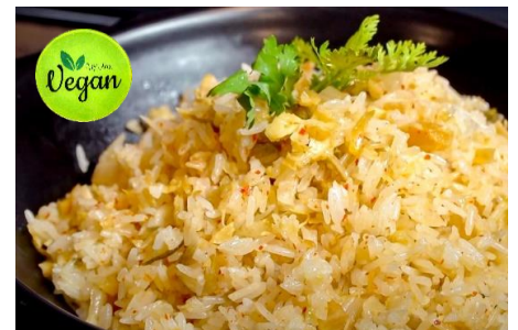
ガーリックチャーハン