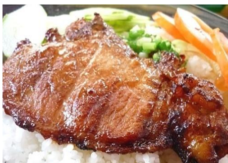
コムスン (豚焼肉のつけ皿ごはん)