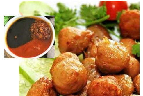
ベトナム屋台の牛肉さつま揚げ