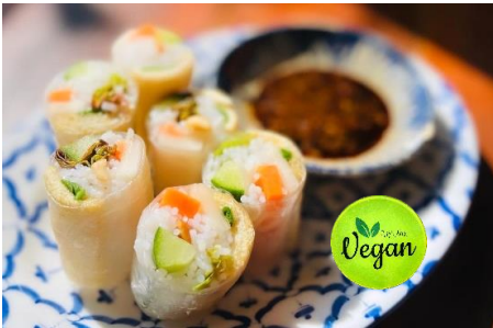
青いパイヤと野菜と揚げ豆腐の生春巻き