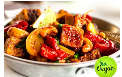
豆腐と香味野菜とカシュナッツの甘辛炒め