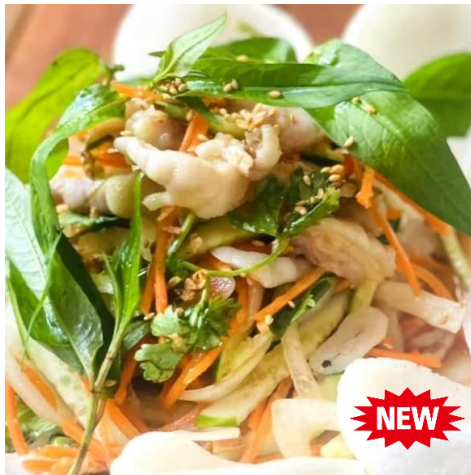
骨なし鶏足もみじの酸っぱ辛いサラダ