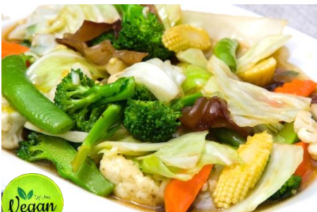
ベトナムいろいろ野菜の炒めもの