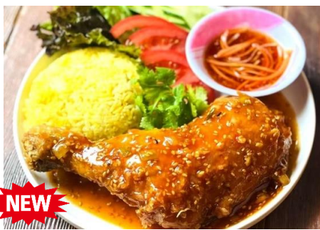
コムガー (ベトナムチキンライス)