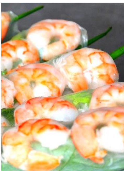
ゴイクン (生春巻き)