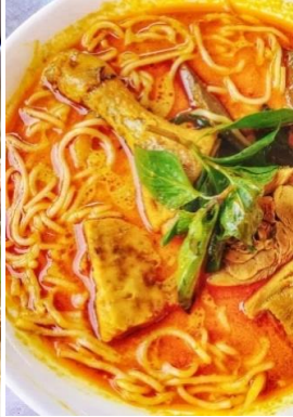
Bún Cà-Ri Gà チキンカレー汁ビーフン ¥1,280