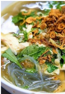
Miến Măng Gà 鶏と竹の子のスープ春雨 ¥1,100