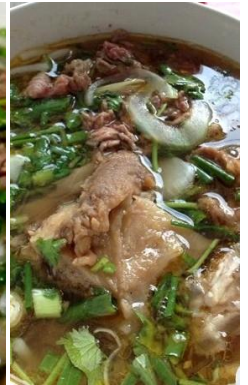
Phở Bò Gân 煮込み牛すじ肉 ¥1,150