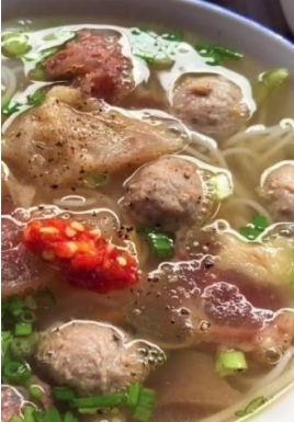
Bún Bò Viên Gân 牛団子とスジ汁ビーフン ¥1,280