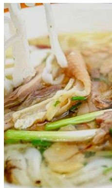
Phở Gà 鶏肉のフォー ¥1,000