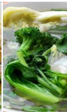
Phở Rau 野菜のフォー ¥1,000