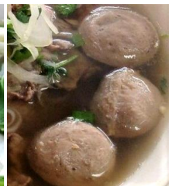
Bò Viên Thêm 追加：牛肉団子 +¥320