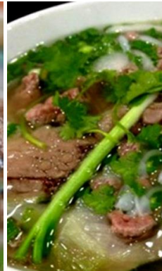
Phở Bò Chín 茹で牛すね肉のフォー ¥1,000