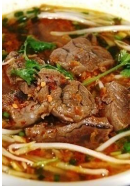
Bún Bò Huế 名物辛い牛肉うどん ¥1,150