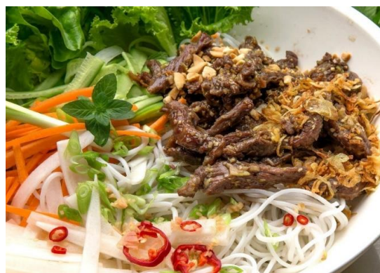
¥1,350 Bún Bò Xào ブンボーサオ (レモングラス風牛焼肉の混ぜ混ぜ麺)