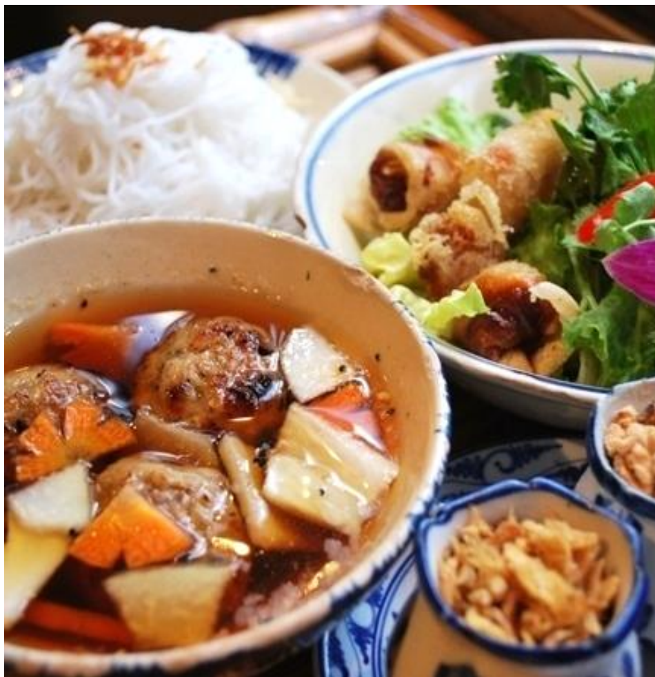
Bún Chả Hà Nội ¥1,200 「ブンチャー」スペシャル混ぜ混ぜ麺 (焼きつくね・豚焼肉・揚げ春巻き・緑野菜・香草)