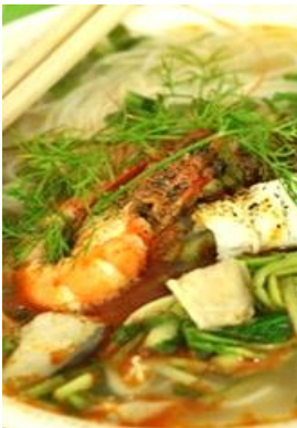
Miến Hải Sản 海鮮スープ春雨 ¥1,280