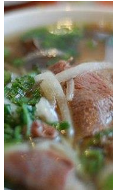
Phở Bò Tái 半生牛肉のフォー ¥1,000