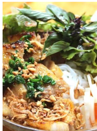
¥1,200 Bún Thịt Nướng 「ブンテイトヌン」 豚バラ焼肉と緑野菜の混ぜ混ぜ麺