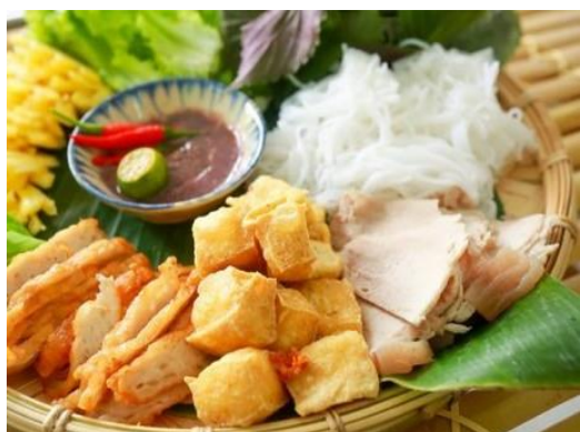
Bún Đậu Mắm Tôm ¥1,200 豆腐と豚ホルモンの発酵海老ダレビーフン