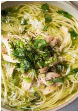
Bún Gà 鶏肉のあっさり汁ビーフン ¥1,000