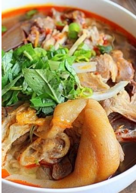
Bún Bò Giò Heo 豚足入り辛い牛肉うどん ¥1,370

+ (Xà Lách Trộn Dầu Dấm + Tráng Miệng) → (Cơm Thịt Heo Kho Dưa Cải Chua)