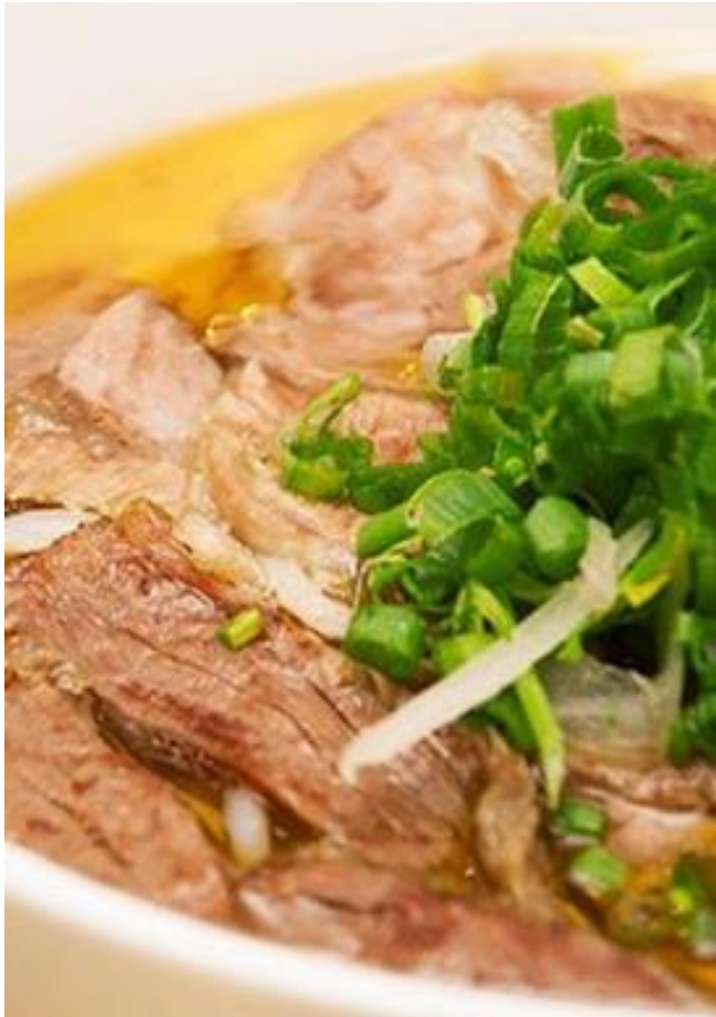
Phở Bò Đặc Biệt ¥1,200 牛肉3種類盛りフォー (茹で牛すね肉, 煮込み牛すじ肉, 半生牛肉)

Phở + (Xà Lách Trộn Dầu Dấm + Tráng Miệng) → (Cơm Thịt Heo Kho Dưa Cải Chua)