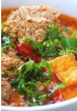
Bún Riêu Cua 蟹ダシ団子汁ビーフン ¥1,280