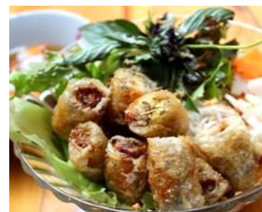
¥1,200 Bún Chả Giò 「ブンチャーゾー」 揚げ春巻きの緑野菜の混ぜ混ぜ麺