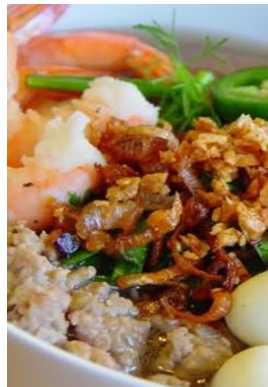
Hủ Tiếu Nam Vang メコンデルタの汁麺 ¥1,280