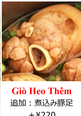
Giò Heo Thêm 追加：煮込み豚足 +¥220