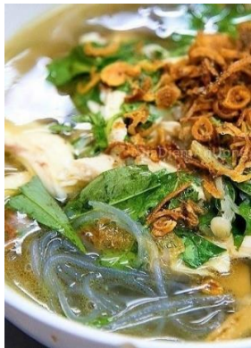
Miến Măng Gà 「ミエンガー」 鶏と竹の子のスープ春雨