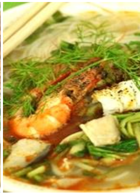
Miến Hải Sản 「ミエンハイサン」 海鮮スープ春雨