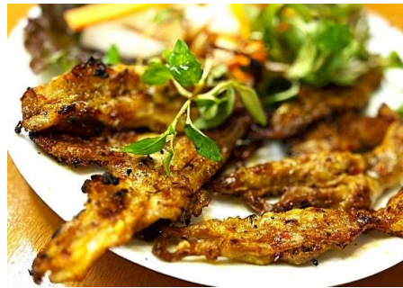
鶏せせりのスパイシーサテ焼き