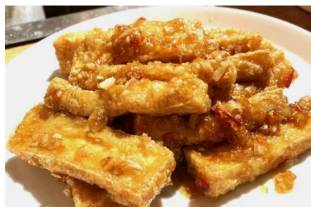
スイートチリレモンガラス風味カリカリ豆腐