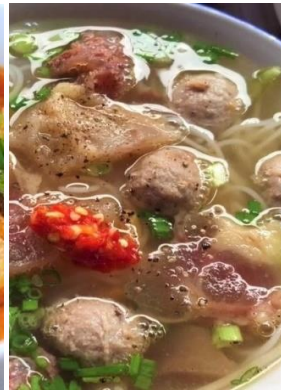
Bún Bò Viên Gân 「ブンボーヴィエン」 牛団子とスジ汁ビーフン