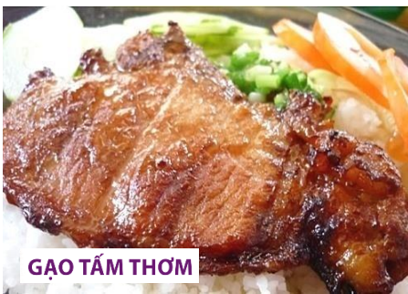
GAO TAM THOM