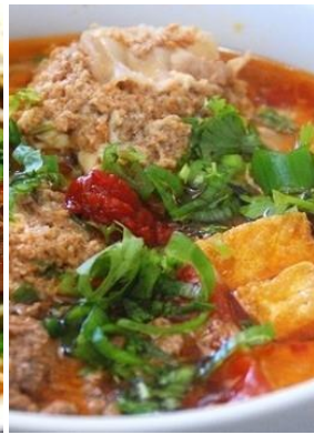
Bún Riêu Cua 「ブンリウクア」 蟹ダシ団子汁ビーフン