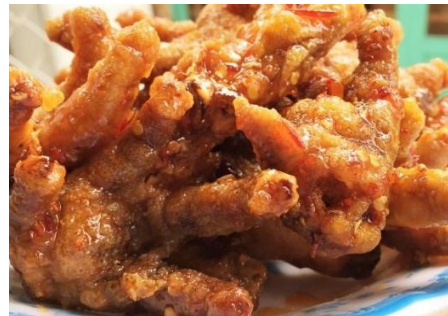
鶏足もみじのスイートチリ炒め