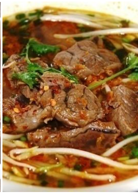
Bún Bò Huế 「ブンボーフエ」 名物辛い牛肉うどん