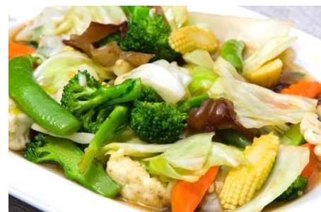
ベトナムいろいろ野菜の炒めもの