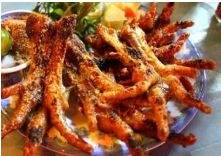
鶏足もみじの辛いサテ焼き