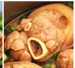
Giò Heo Thêm 追加：煮込み豚足 + ¥190