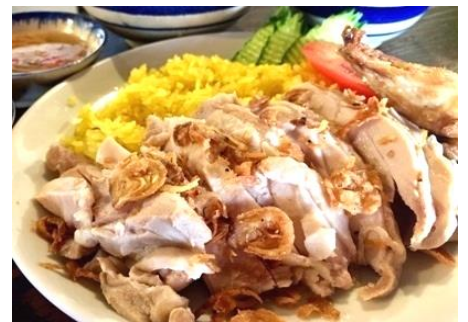
コムガー (ベトナムチキンライス)