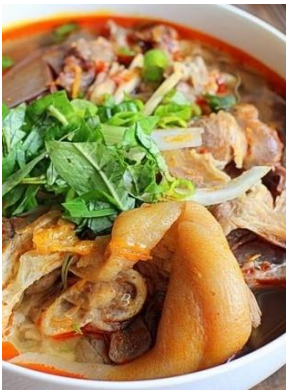
Bún Bò Giò Heo 「ブンボージョーヘオ」 豚足入り辛い牛肉うどん