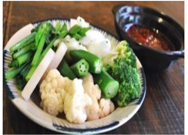
ラウルク (温野菜の盛り合わせ 肉海老ダレで)