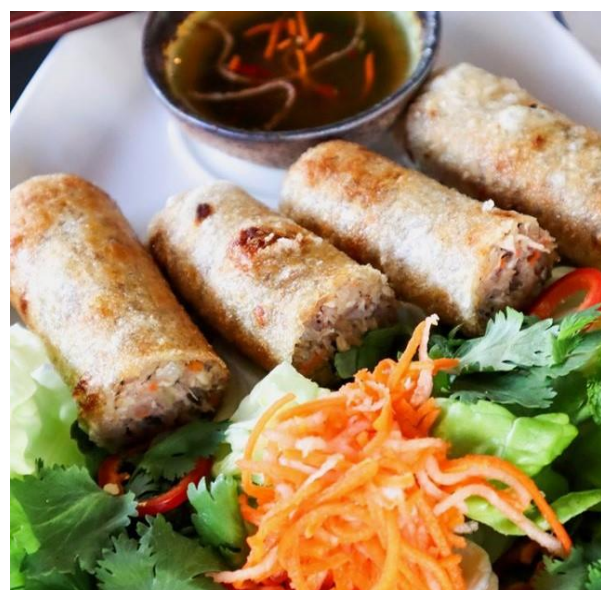
野菜のヴィーガン揚げ春巻き