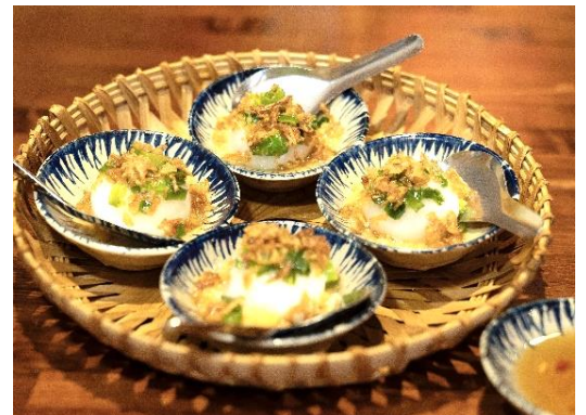
バインイト (海老のもちもち蒸し団子)