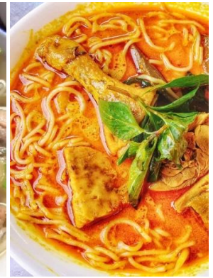
Bún Cà-Ri Gà 「ブンカリー」 チキンカレー汁ビーフン