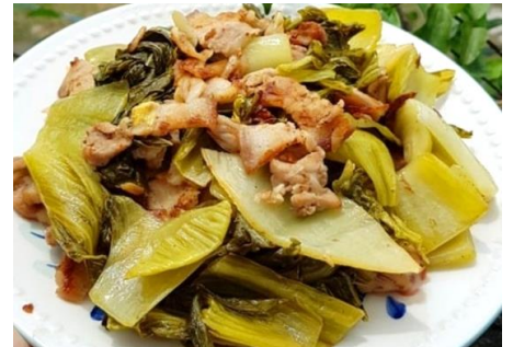
厚切り豚バラ肉と高菜漬けのピリ辛炒め