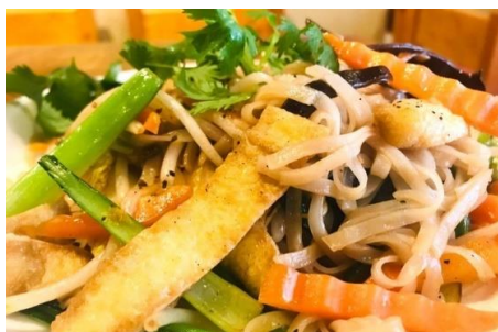
ヴィーガン焼きフォー