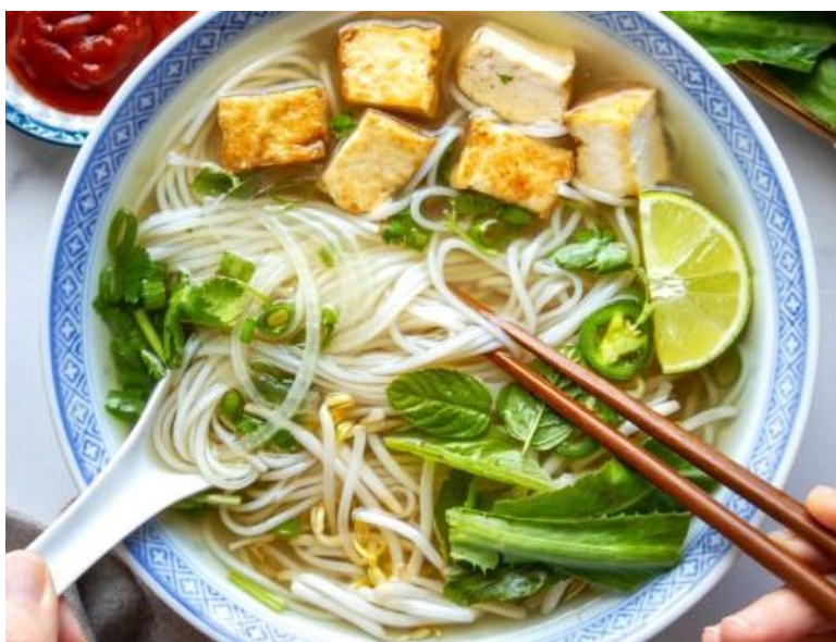
ヴィーガンフォー