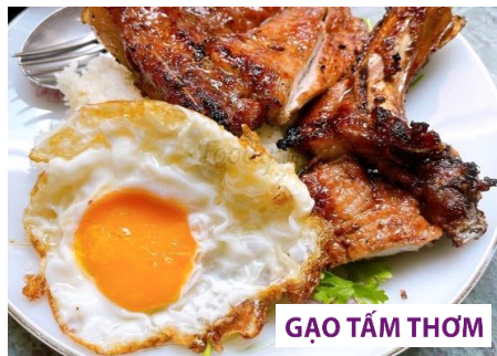
GAO TAM THOM