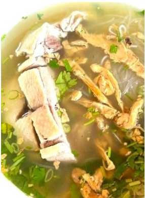
Miến Măng Vịt 「ミエンヴァット」 アヒルと竹の子のスープ春雨