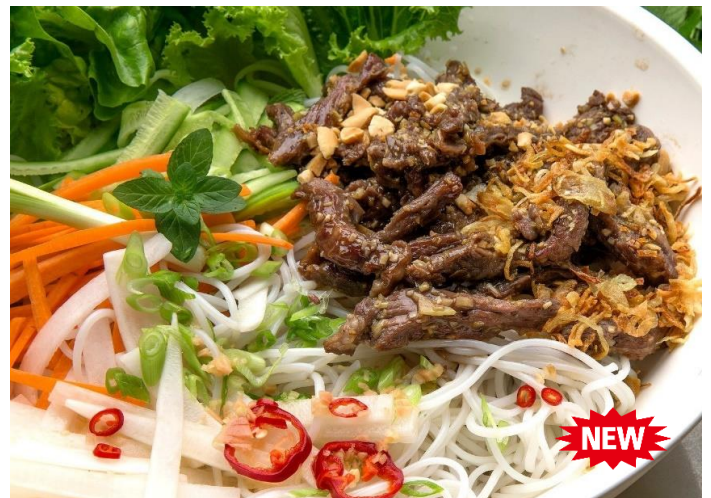
レモングラス風牛焼肉の混ぜ混ぜ麺