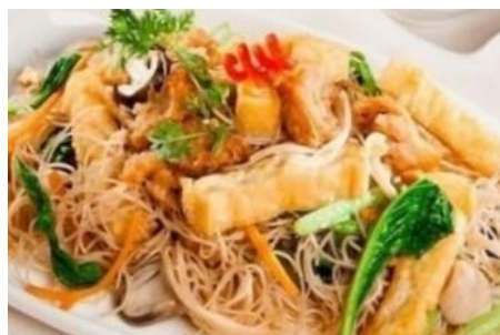
ヴィーガン焼きビーフン