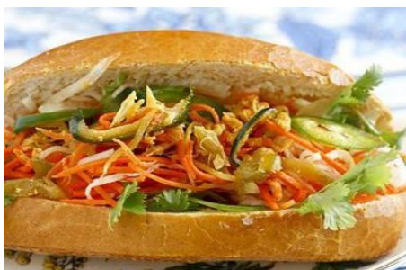
青いパイヤなどヴィーガンサンドイッチ