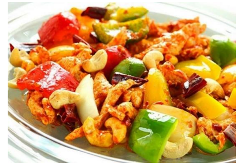
鶏肉とカシュナッツの甘辛炒め