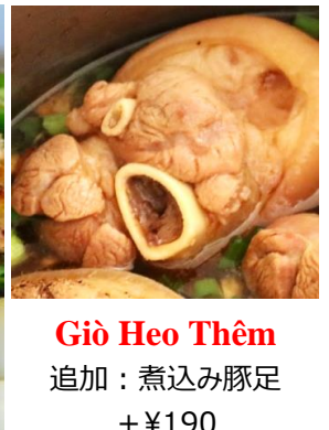
Giò Heo Thêm 追加：煮込み豚足 + ¥190