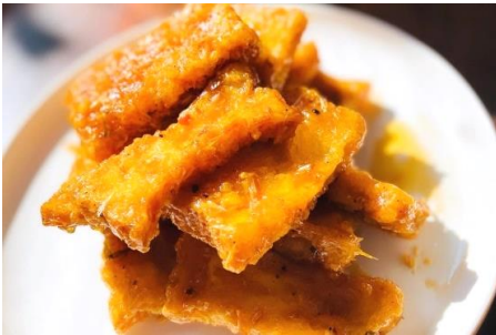
スイートチリレモングラス風味カリカリ豆腐