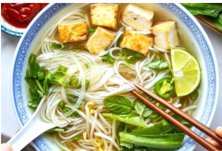
ヴィーガンフォー