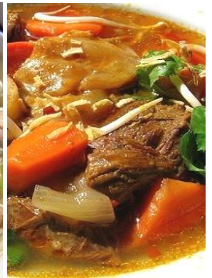
Bún Bò Kho 「ブンボーコー」 スパイシー牛肉うどん