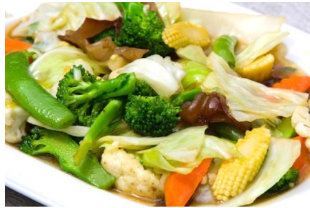
ベトナム野菜炒め