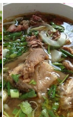
煮込み牛すじ肉のフォー