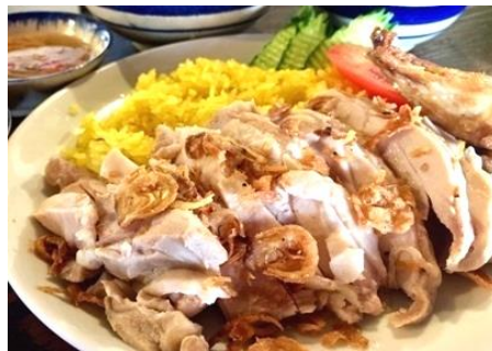
コムガー (ベトナムチキンライス)