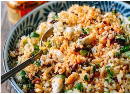
ベトナム蟹チャーハン