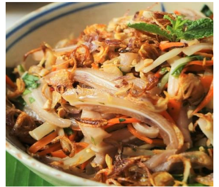
豚の耳のピリ辛サラダ