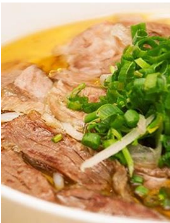
牛肉3種類盛りフォー