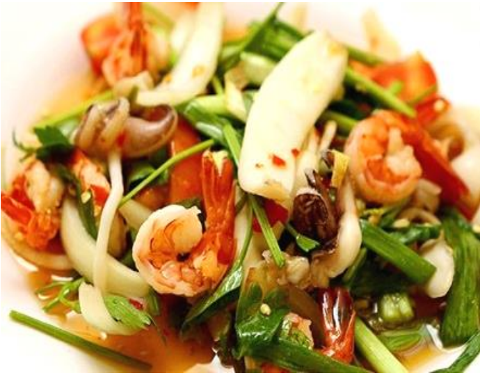
海老とイカのチリレモングラス炒め