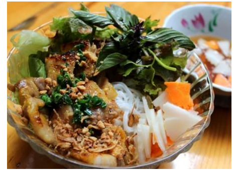
豚焼肉と緑野菜の混ぜ混ぜ麺