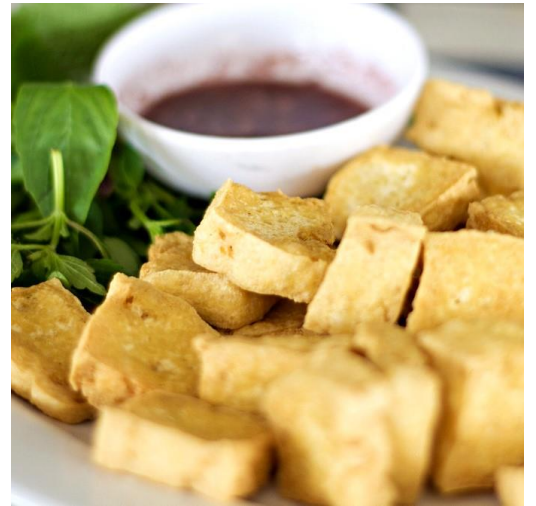
揚げ豆腐 マムトム臭い海老だれで