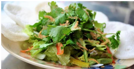
パクチーのフレッシュグリーンサラダ