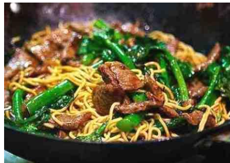
牛肉のインスタント麺焼きそば