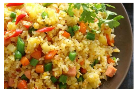
ヴィーガンチャーハン