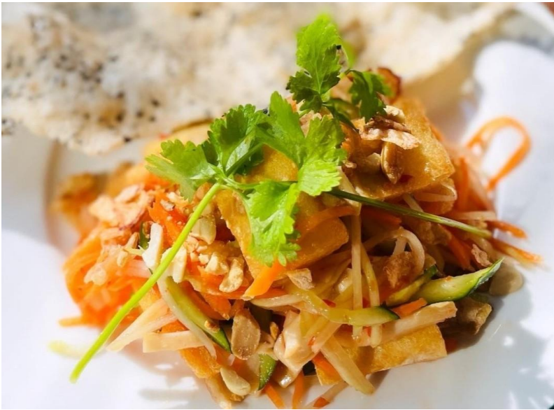
キノコと豆腐のヴィーガンサラダ 黒ゴマせんべいと