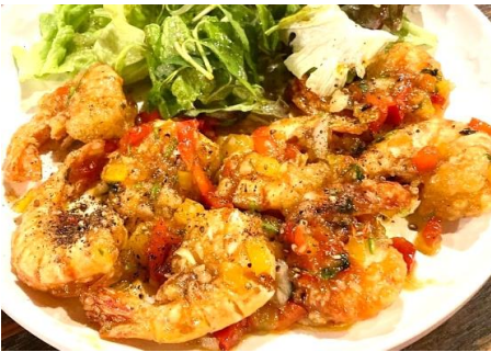
海老のガーリック炒め