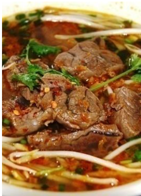
Bún Bò Huế 「ブンボーフエ」 名物辛い牛肉うどん