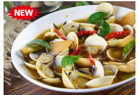
ハマグリ of 辛酸っぱいタイ風蒸し