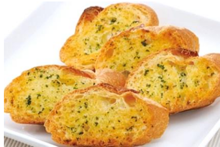
パクチーのガーリクトースト