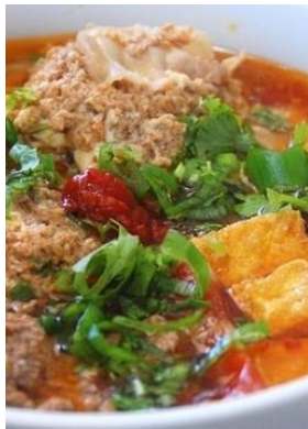
Bún Riêu Cua 「ブンリウクア」 蟹ダシ団子汁ビーフン