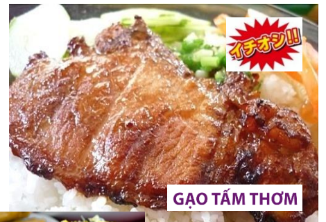
GAO TẤM THƠM