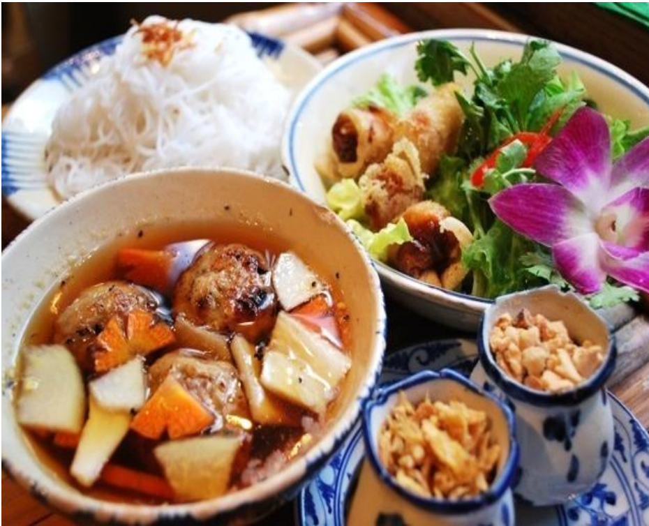
ブンチャー (スペシャル混ぜ混ぜ麺)