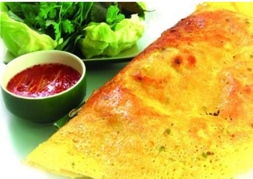
バインセオ (ベトナム版お好み焼き)