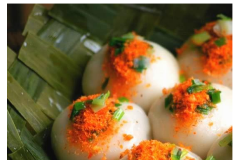
バインイト (海老のもちもち蒸し団子)