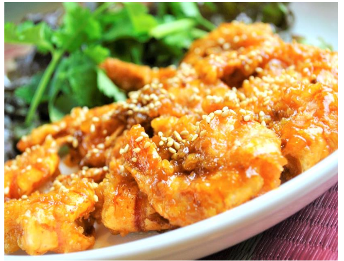
海老の甘酸っぱいタマリンドソース