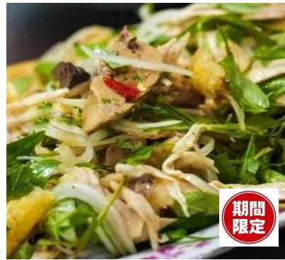
コリコリ親鳥とラウラム(タデ)のサラダ