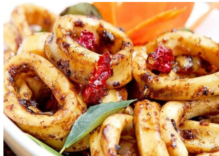
スルメイカのスパイシーサテ焼き