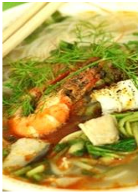
Miến Hải Sản 「ミエンハイサン」 海鮮スープ春雨