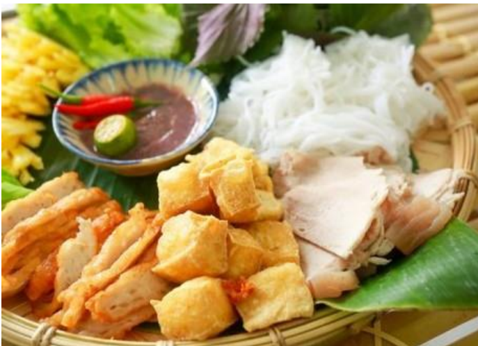
豆腐と豚ホルモンの発酵海老ダレビーフン (ゆで豚・子袋・豚舌)