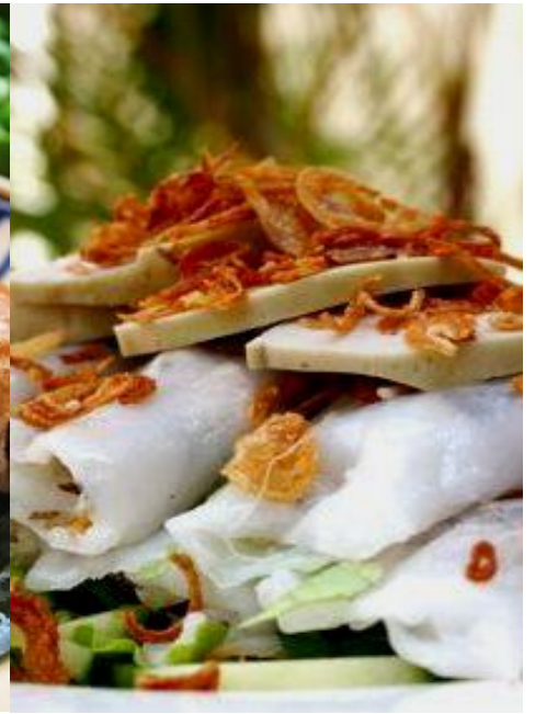
バインクン (蒸し春巻き)