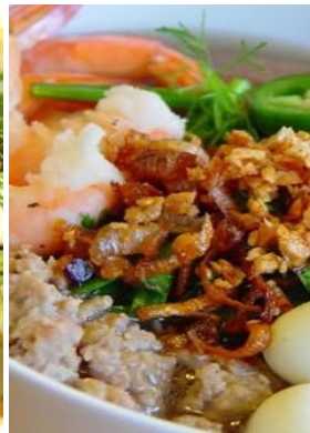
Hủ Tiếu Nam Vang 「フーティユ」 メコンデルタの汁麺