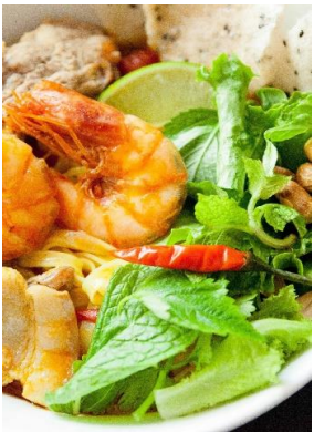
Mì Quảng 「ミークアン」 ダナン名物 海老だし汁麺