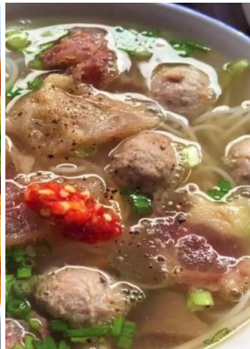
Bún Bò Viên Gân 「ブンボーヴィエン」 牛団子とスジ汁ビーフン