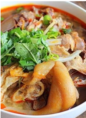
Bún Bò Giò Heo 「ブンボージョーヘオ」 豚足入り辛い牛肉うどん