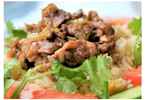
牛肉と高菜漬けのハノイ名物チャーハン