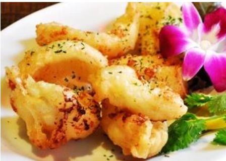
イカのサクサク衣揚げ 焦しバター風味