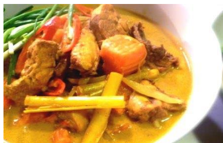
チキンのココナッツカレーフォー