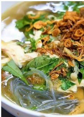
Miến Măng Gà 「ミエンガー」 鶏と竹の子のスープ春雨