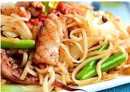
フォーサオ (ベトナムの焼きフォー)