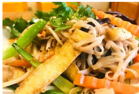
ヴィーガン焼きフォー