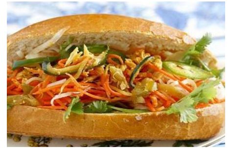
青いパパイヤなどヴィーガンサンドイッチ