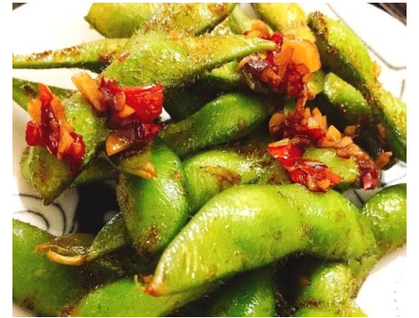
枝豆のガーリックとんがらし炒め