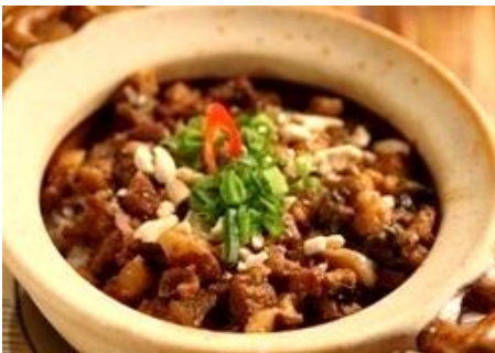
甘辛い煮豚と高菜の土鍋焼きごはん