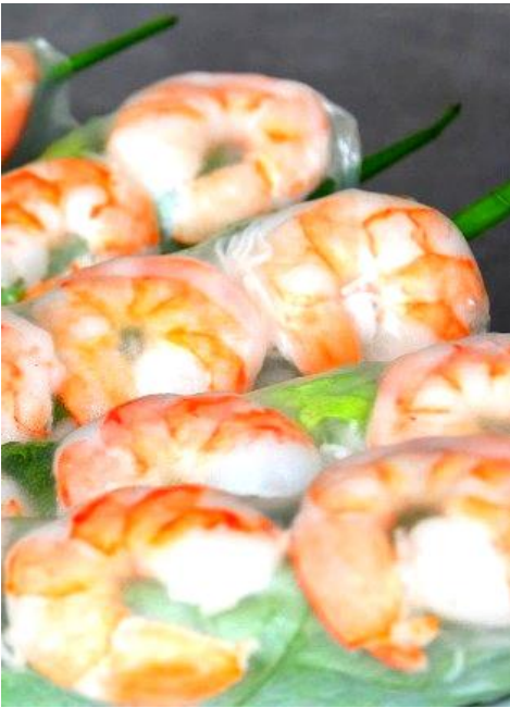
ゴイクン (生春巻き)