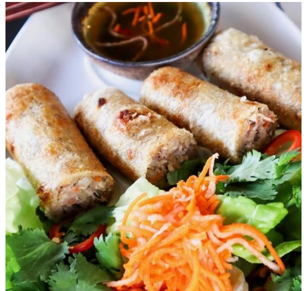
野菜と揚げ豆腐の揚げ春巻き