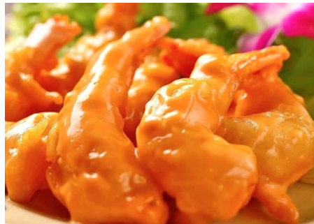
海老のマヨチリソース