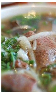
半生牛肉のフォー