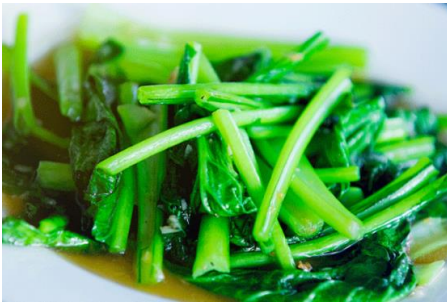
旬の青菜のにんにく炒め