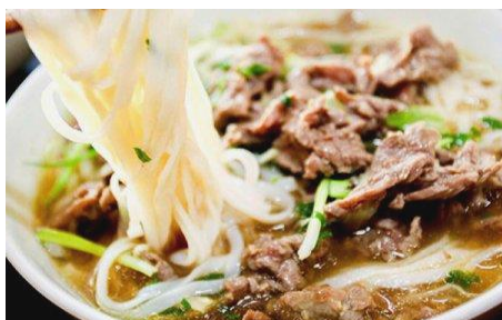
スタミナ炒め牛肉のフォー