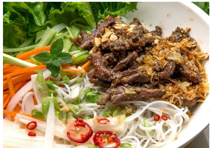
レモングラス風牛焼肉の混ぜ混ぜ麺