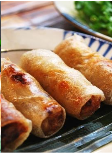
チャーゾー (揚げ春巻き)