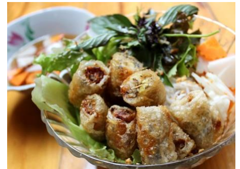
揚げ春巻きの緑野菜の混ぜ混ぜ麺