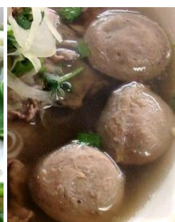
追加：牛肉団子 追加：煮込み豚足 追加：タマゴスープ