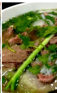
茹で牛すね肉のフォー