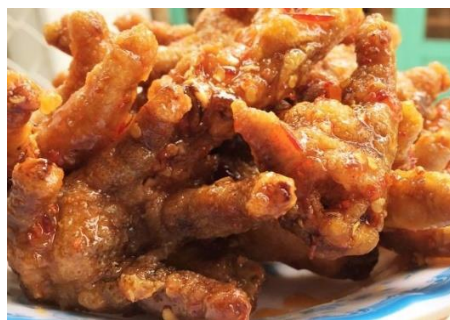
鶏足もみじのスイートチリ炒め