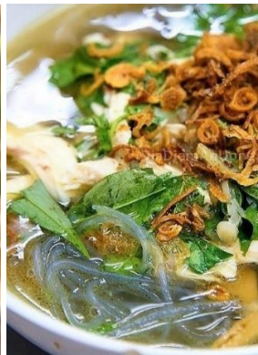
Miến Măng Gà 「ミエンガー」 鶏と竹の子のスープ春雨