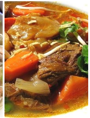
Bún Bò Kho 「ブンボーコー」 スパイシー牛肉うどん