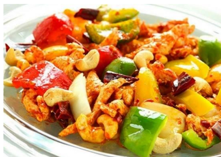
鶏肉とカシュナッツの甘辛炒め