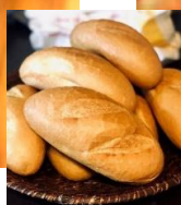
牛肉と人参のスパイシー煮込み + ベトナムバインミー