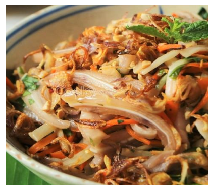
豚の耳のピリ辛サラダ