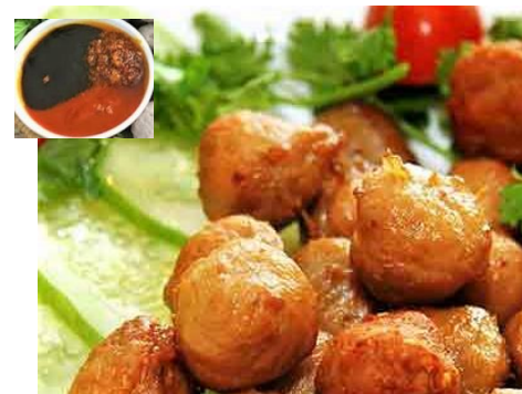
牛肉のさつま揚げ