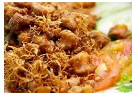
なんこつの唐揚げ フライドレモングラス風味