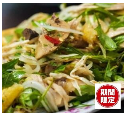
コリコリ親鳥とラウラム(タデ)のサラダ