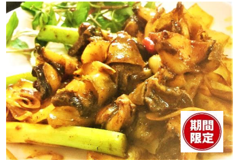
赤ニシ貝のレストランチリ炒め