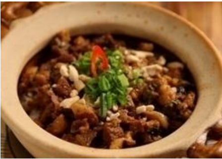
甘辛い煮豚と高菜の土鍋焼きごはん