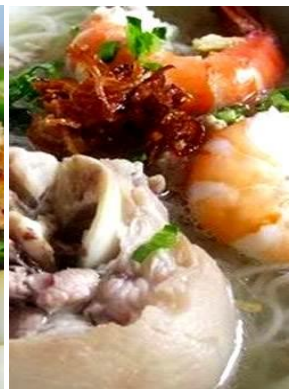
Hủ Tiếu Giò Heo 「フーティユジョーヘオ」 豚足入り海老米麺