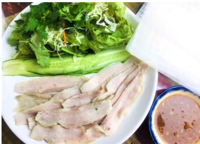
ベトナムの茹で豚 ライスペーパーで巻いて