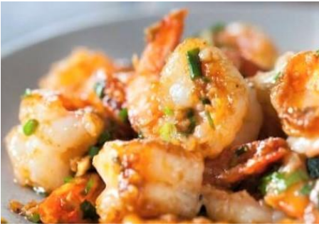
海老のガーリック炒め