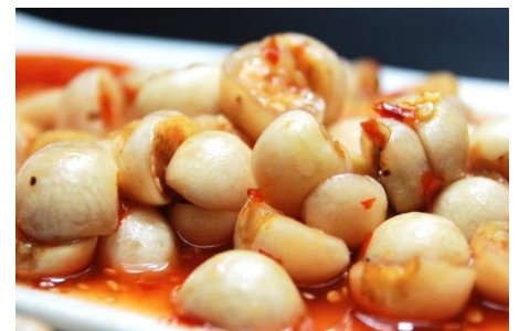
白茄子のベトナムキムチ