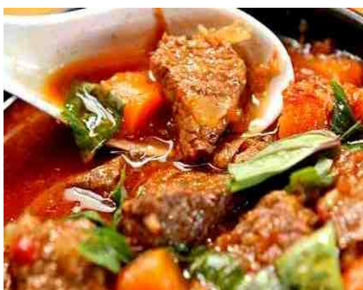
ボ－コー 牛肉と人参のスパイシー煮 フランスパンと