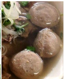
追加：牛肉団子 追加：タムゴスープ