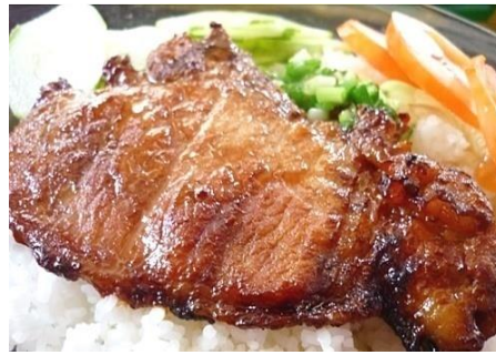
コムスン (豚焼肉のつけ皿ごはん)