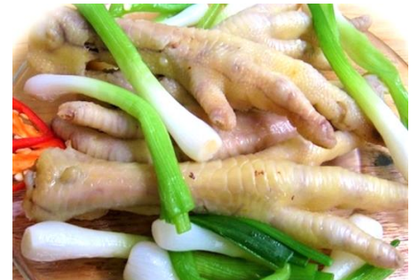
ゆでもみじ (Hấp Hành)