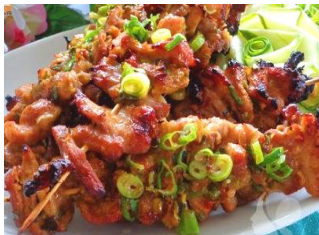
豚肩ロースの屋台風串焼き