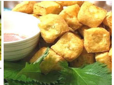
揚げ豆腐 マムトム臭い海老だれで