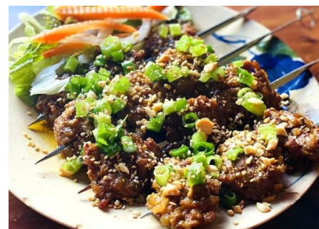
手ごねベトナム焼きつくね