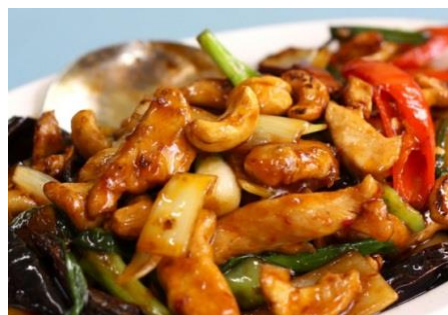
鶏肉とカシュナッツの甘辛炒め