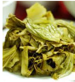
ベトナム高菜漬け