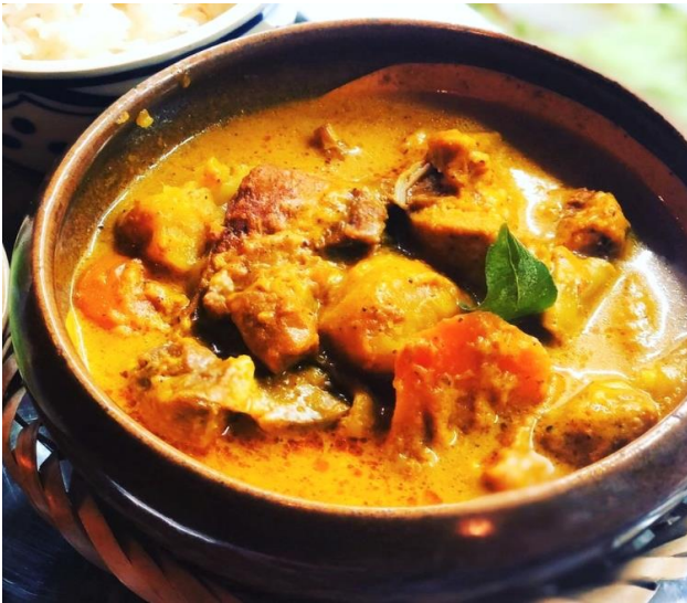
チキンのココナッツカレー フランスパンと