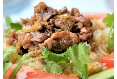
牛肉と高菜漬けのハノイ名物チャーハン