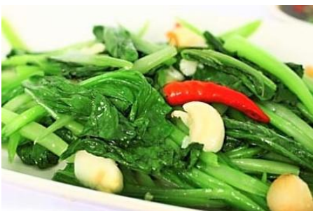
旬の青菜のにんにく炒め