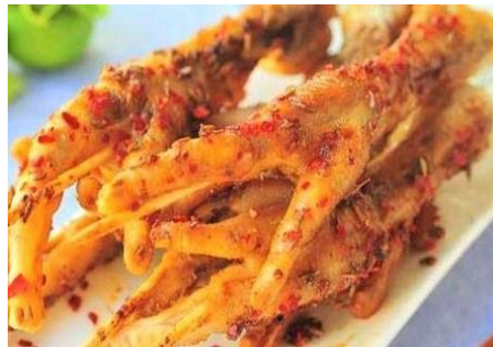
もみじのサテ焼き (Nướng Sa Tế)