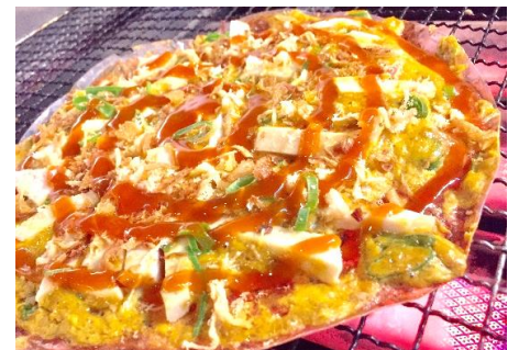
ライスペーパーのベトナムピザ