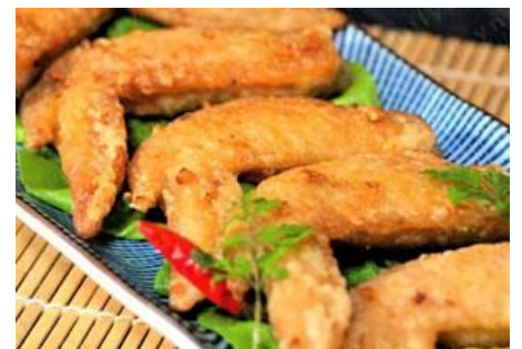
手羽先のヌックママバター風味