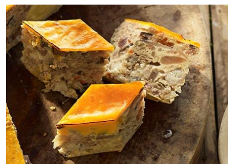
ひき肉と海老のふわふわ卵とじ蒸し