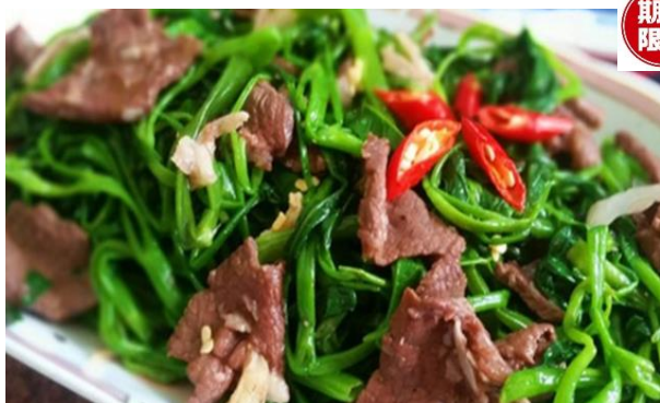
牛肉と空芯菜の炒めもの