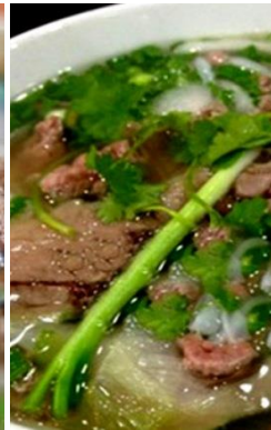
茹で牛すね肉のフォー