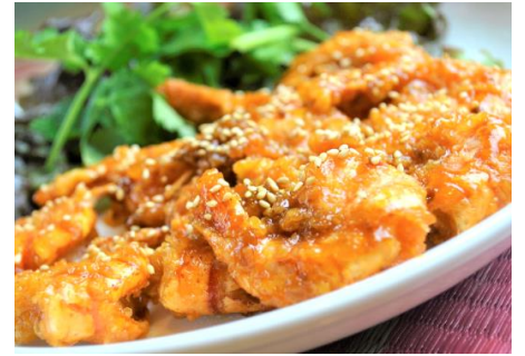
海老の甘酸っぱいたマリンドソース