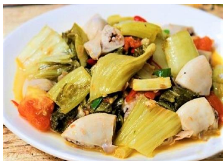
豚ホルモンと高菜のピリ辛炒め