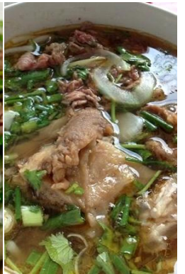
煮込み牛すじ肉のフォー