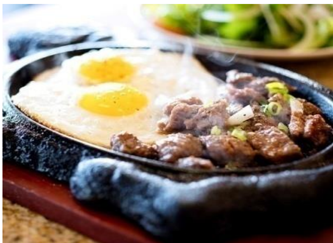
ボ－ネ－ (ベトナムの鉄板焼肉)