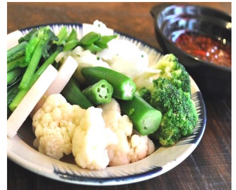
ラウルック (温野菜の盛り合わせ)