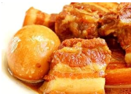
豚の角煮と煮卵 ～ココナッツジュース煮～