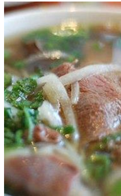
半生牛肉のフォー