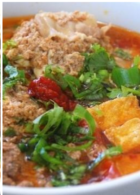
Bún Riêu Cua 「ブンリウクア」 蟹ダシ団子汁ビーフン