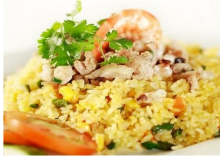
海老とレタスのレモングラスチャーハン