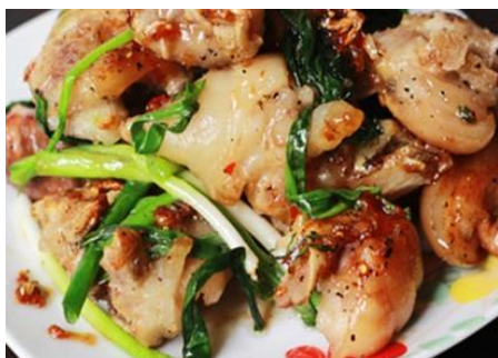
豚足の甘辛スックマム炒め