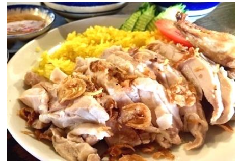
コムガー (ベトナムチキンライス)