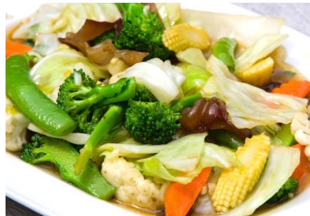
ベトナム野菜炒め