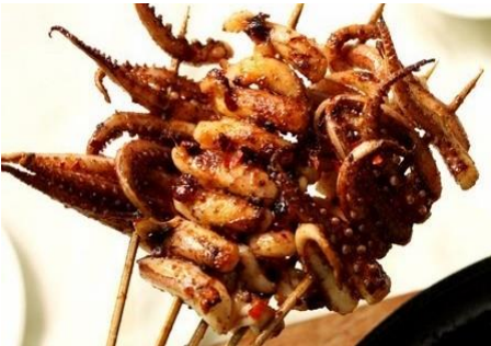
イカゲソのサテ風味串焼き