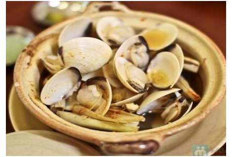
ハマグリのレストラン蒸し