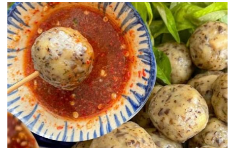
ジャガイモとキノコのレモン葉風味団子