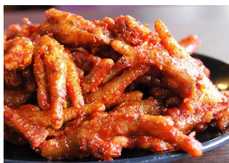
もみじのサテ炒め (Xào Sa Té)