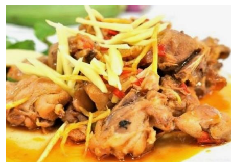
鶏肉のココナツミルク生姜炒め煮込み