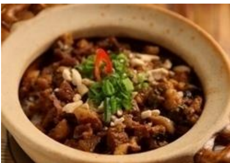
甘い煮豚と高菜の土鍋焼きごはん