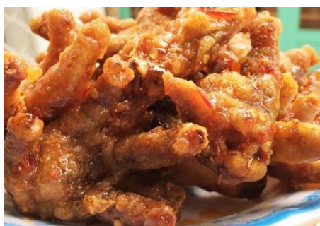
もみじのスイートチリ炒め (Chua Ngot)