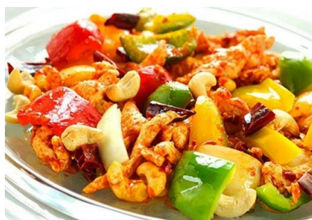
鶏肉とカシュナツの甘辛炒め