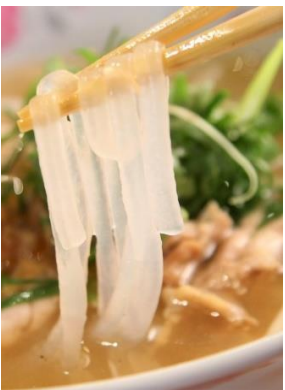
Bánh Canh Gà 「バインカン」 鶏肉タピオカもちもち麺