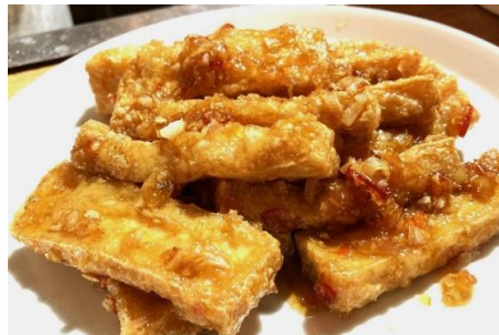
スイートチレモングラス風味カリカリ豆腐