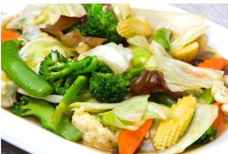
ベトナムいろいろ野菜の炒めもの