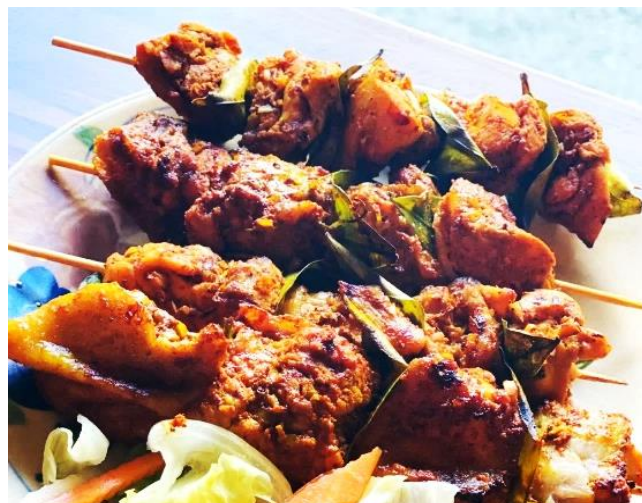
もも鶏のヨーグルトラーチャン包み焼き 1本〜