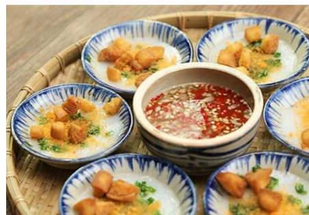
バインベオ (フエの小皿の蒸し餅 海老田麩とネギ油のせ)