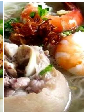
Hủ Tiếu Giò Heo 「フーティユジョーヘオ」 豚足入り海老米麺