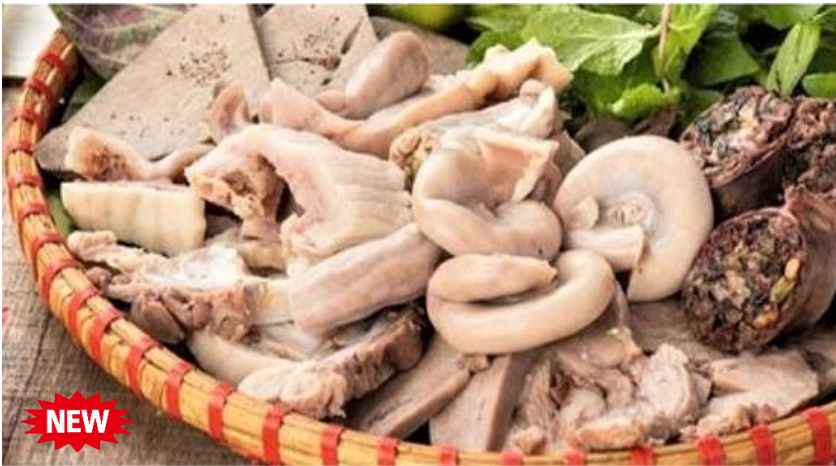
ホルモンの盛り合わせ Heo Mẹt