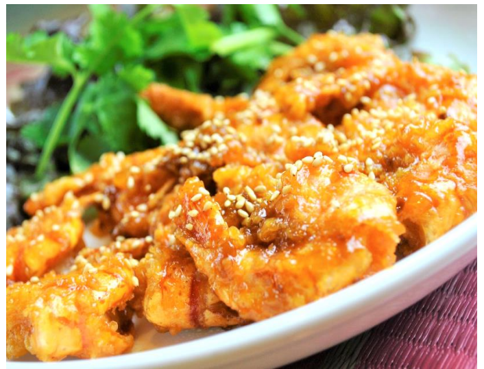
海老の甘酸っぱいタマリンドソース