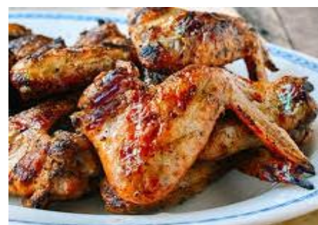
手羽先の辛いサテ焼き