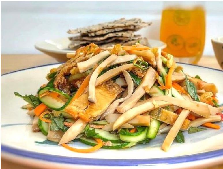
キノコと豆腐のヴィーガンサラダ 黒ゴマせんべいと