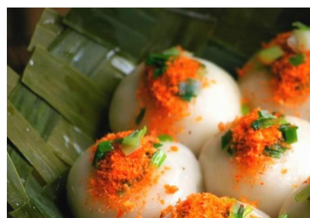
バインイト (海老のもちもち蒸し団子)