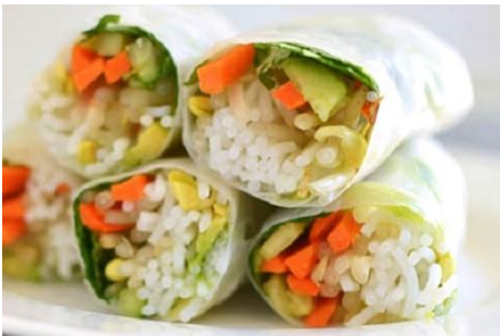
青いパイヤと野菜と揚げ豆腐の生春巻き