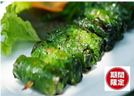
牛肉のロット(葡萄)の葉包み焼き