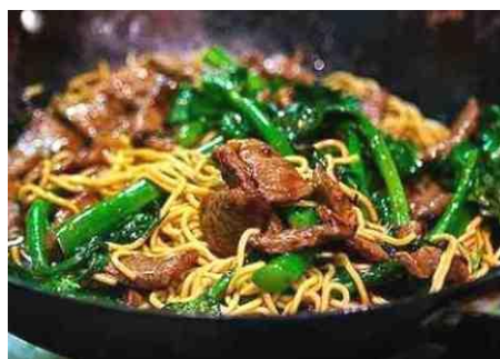
牛肉のインスタント麺焼きそば