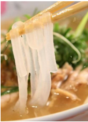
Bánh Canh Gà 「バインカン」 鶏肉タピオカもちもち麺