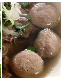
追加：牛肉団子 追加：タモゴスープ