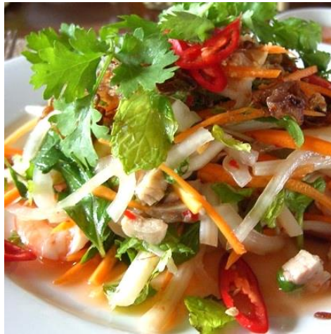
ハスの茎と海老の甘酸っぱいサラダ