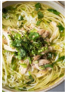
Bún Gà 「ブンガー」 鶏肉のあっさり汁ビーフン