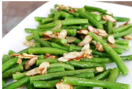
インゲン豆のんにく炒め