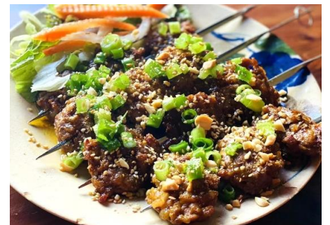
手ごねベトナム焼きつくね