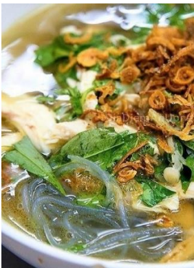
Miến Măng Gà 「ミエンガー」 鶏と竹の子のスープ春雨