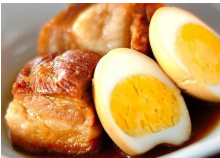
豚の角煮と煮卵 ～ココナッツジュース煮～