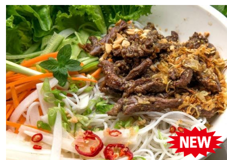
牛肉炒めと緑野菜の混ぜ混ぜ麺