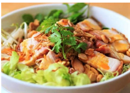
コムヘオクワイ (カリッカリ塩豚ライス)