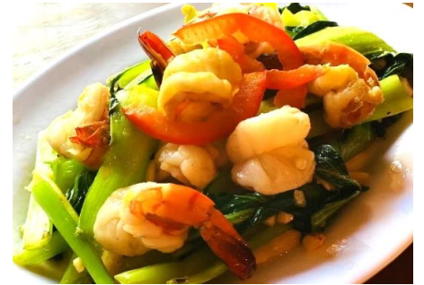
海老とチンゲン菜の炒めもの