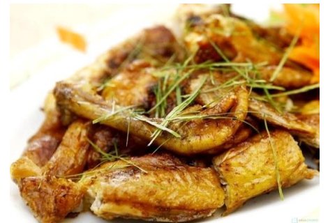
親鳥の丸焼き こぶみかんの葉風味