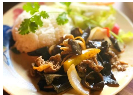
コムボーサオ (炒め牛肉ライス)