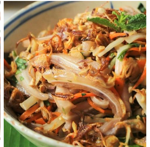
豚の耳のピリ辛サラダ