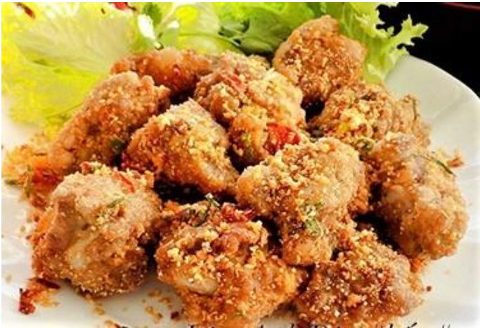
なんこつ豚のスパイシー唐揚げ