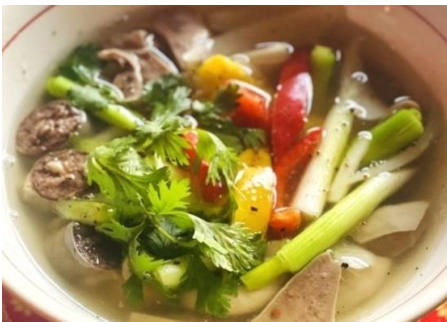
Lòng Trần ホルモン4種類