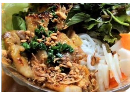
豚焼肉と緑野菜の混ぜ混ぜ麺