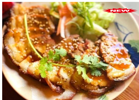
ホイアン名物チャーシュー