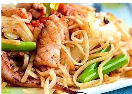
フォーサオ (ベトナムの焼きフォー)