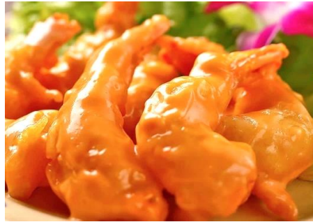
海老のマヨチリソース