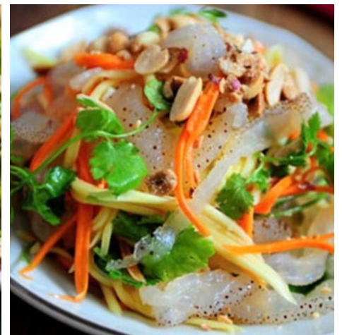
クラゲの甘酸っぱいサラダ