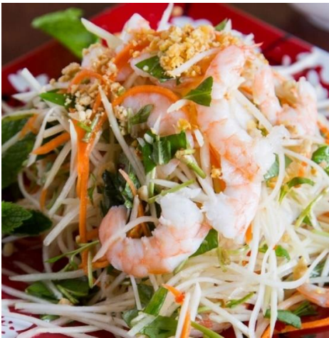
青いパイヤのサラダ