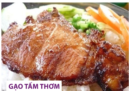
GAO TẮM THƠM