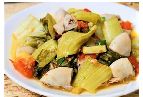
豚ホルモンと高菜のピリ辛炒め