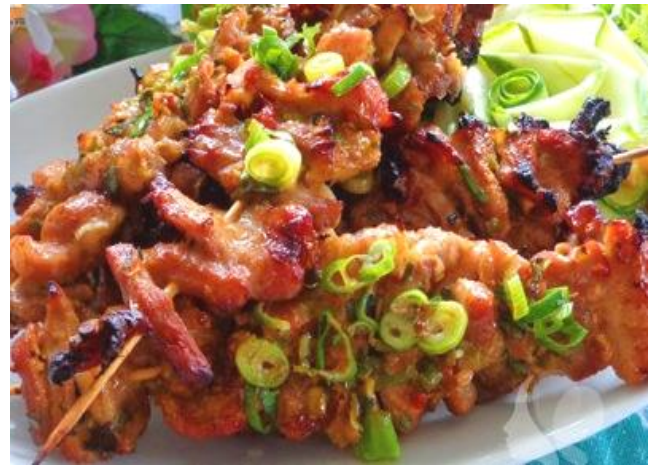
豚肩ロースの屋台風串焼き