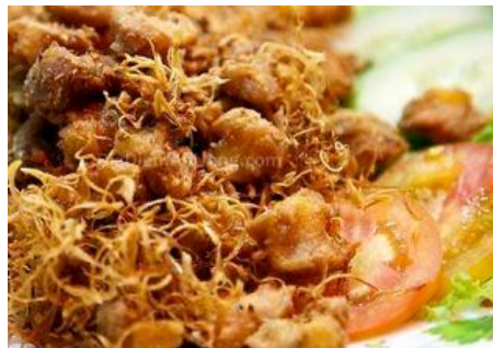
なんこつの唐揚げ フライドレモングラス風味