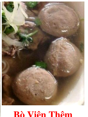
Bò Viên Thêm 追加：牛肉団子