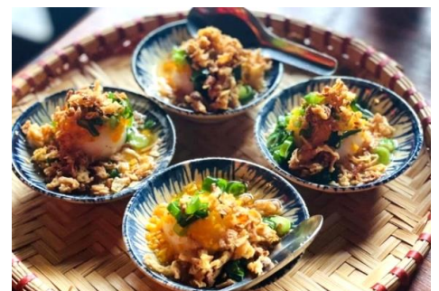
バインイト (海老のもちもち蒸し団子)