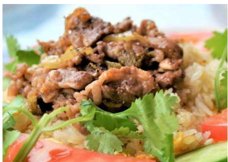
牛肉と高菜漬けのハノイ名物チャーハン