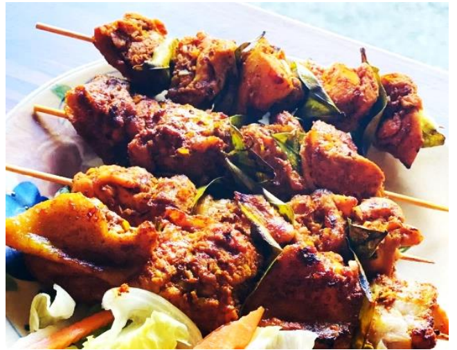
もも鶏のヨーグルトラーチャン包み焼き 1本〜