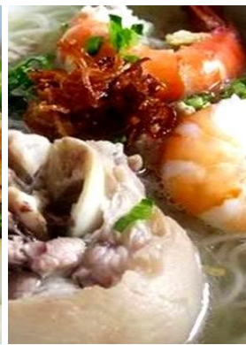
Hủ Tiếu Giò Heo 「フーティユジョーヘオ」 豚足入り海老米麺