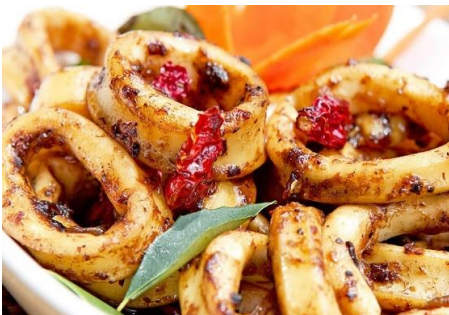
スルメイカのスパイシーサテ焼き