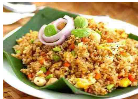
ベトナムソーセージの伝統チャーハン