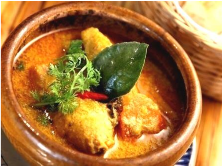
チキンのココナッツカレー + ベトナムバインミー