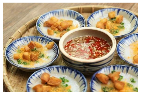
バインベオ (フエの名物 小皿の蒸し餅)