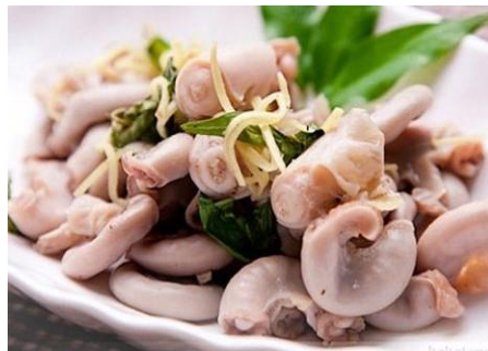
茹で豚コブクロ 発酵海老ダレで