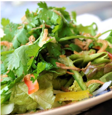
パクチーのフレッシュグリーンサラダ