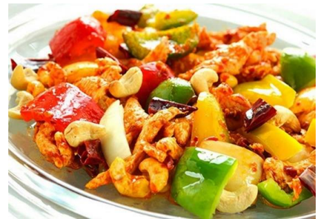
鶏肉とカシュナッツの甘辛炒め