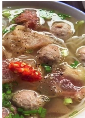
Bún Bò Viên Gân 「ブンボーヴィエン」 牛団子とスジ汁ビーフン