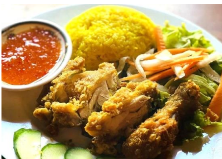
コムガー (ベトナムチキンライス)