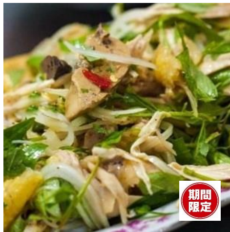
親鳥とラウラム(タデ)のサラダ