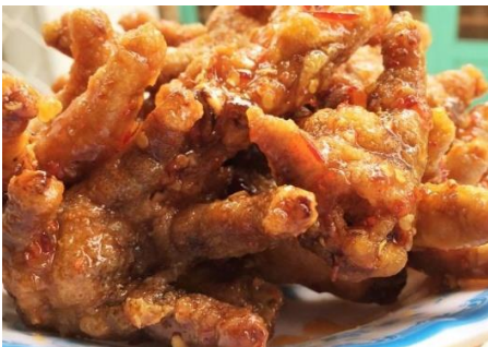
もみじのスイートチリ炒め (Chua Ngot)