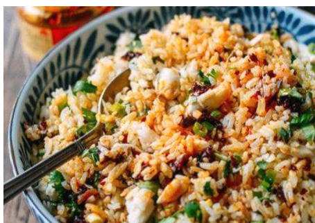
ベトナム蟹チャーハン