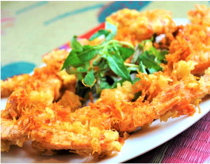
海老の塩ガーリック揚げ