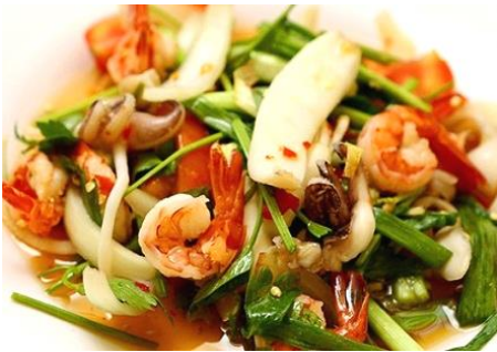
海老とイカのチリレモングラス炒め