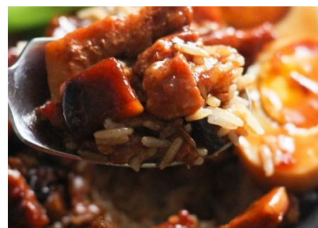
コムティットコー (豚の角煮と煮卵ごはん)