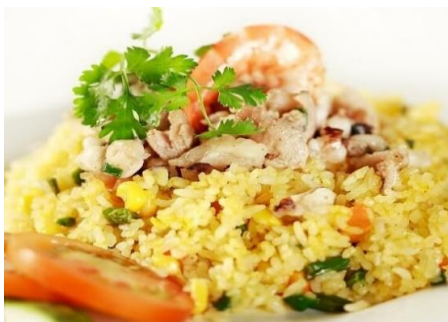
ベトナム海鮮チャーハン