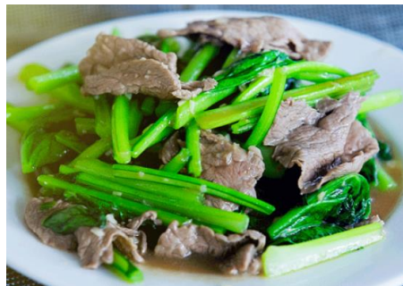
牛肉と青菜の炒めもの