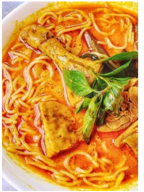
Bún Cà-Ri Gà 「ブンカリー」 チキンカレー汁ビーフン