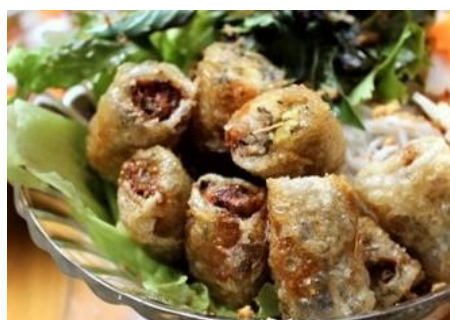
揚げ春巻きの緑野菜の混ぜ混ぜ麺