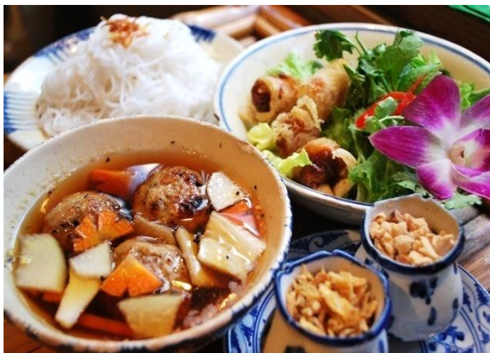
ブンチャー (スペシャル混ぜ混ぜ麺)