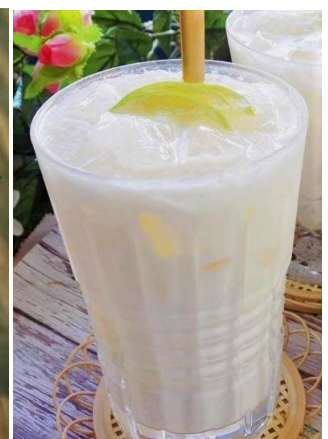
ヨーグルト練乳ドリンク Sữa Chua Đá