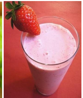
イチゴのシェイク Sinh Tố Dâu Tây (Theo Mùa)