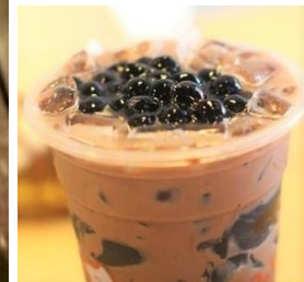
タピオカ抹茶ミルク Trà Sữa Trân Châu vị Trà Xanh