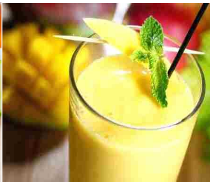
マンゴーのシェイク Sinh Tố Xoài