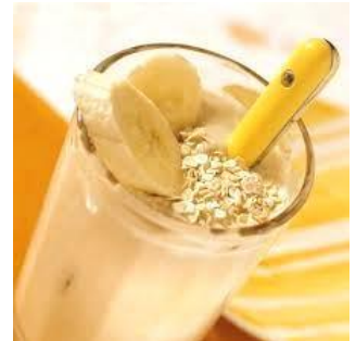
バナナのシェイク Sinh Tố Chuối