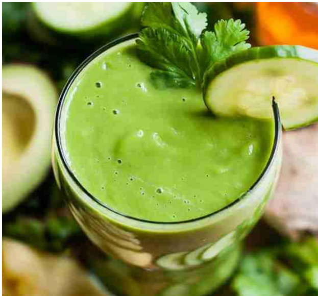
アボカドのシェイク Sinh Tố Bơ