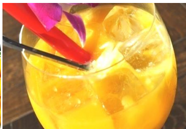
タピオカマンゴー ジュース/ヨーグルト/ココナツ Nước ép Xoài / Xoài Yogurt / Xoài Dừa