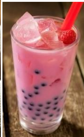
タピオカイチゴミルク Trà Sữa Trân Châu vị Dâu Tây