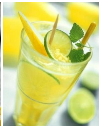
フレッシュレモンスカッシュ Soda Chanh