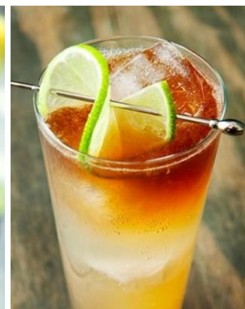
ベトナム茶のフレッシュレモン割り Trà Chanh