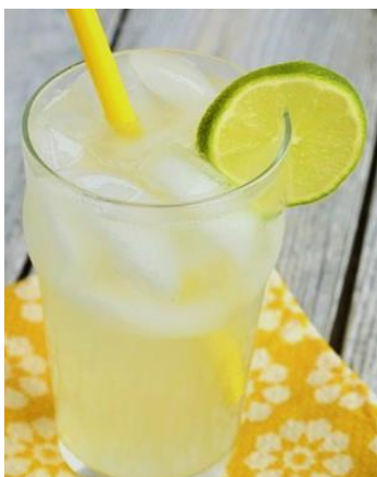
フレッシュレモネード Đá Chanh