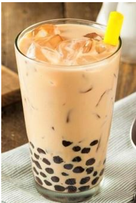
タピオカマンゴー ジュース/ヨーグルト/ココナツ Trà Sữa Trân Châu Đen